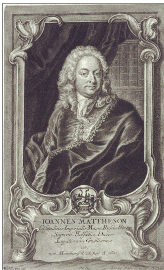
Johannes Mattheson, grabado de Johann-Jakob Haid, 1746.

Telemann ya había demostrado su excepcional apego a esta forma cuando publicó su primera serie de los Cuartetos de París en Hamburgo, en 1730. Los reimprimó